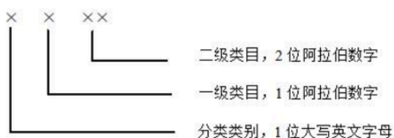
图 2 资源格式分类代码结构