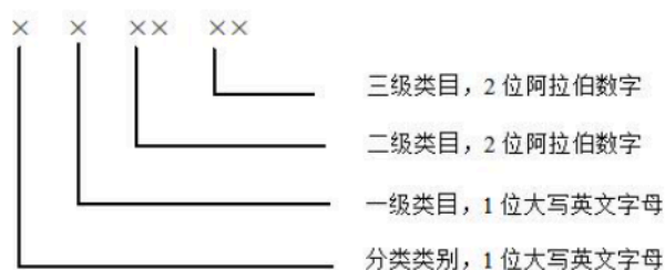
图 6 适用学习者分类代码结构