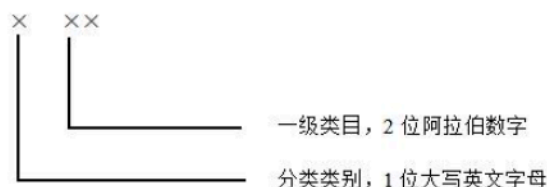
图 3 交互类型分类代码结构